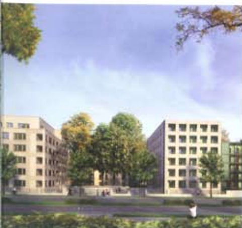
Gesamtübersicht Projekt „Hansaallee“ Westend

eines innerstädtischen Blockes mit einem ehemaligen Straßenbahndepot. Das städtebauliche Konzept sieht die Anlage eines städtischen Platzes vor dem Depot vor, das zu einem Supermarkt umgebaut wurde. Die Architektur ist eher zurückhaltend und orientiert sich in ihrer Sprache an den umliegenden Gründerzeitgebäuden. Wir wollen primär unsere Vorstellung von städtischem Wohnen realisieren. Dies bedeutet typologisch, dass wir eben keine Balkone vor das Haus stellen, sondern die Freibereiche der Wohnungen in die Fassade integrieren. Dies war die eigentliche Herausforderung des Projektes. An den Grundrissen und Ansichten wird deutlich, dass wir sehr konventionelle Gebäude bauen, die an die Tradition des städtischen Hauses anknüpfen. Wie bei dem nachfolgenden Projekt waren auch hier drei unterschiedliche Architekten beteiligt: Stefan Forster Architekten, Scheffler & Partner und Albert Speer & Partner.