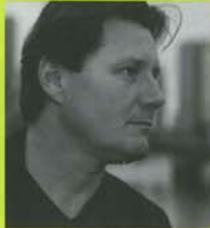
Stefan Forster Stefan Forster Architekten, Frankfurt a.M.